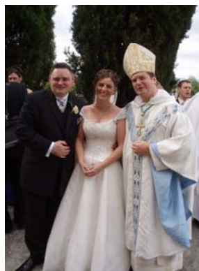
Matrimonio celebrato il mese scorso dal Vescovo Anthony